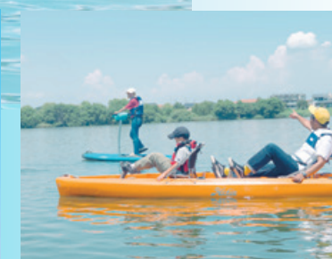
1人乗り足漕ぎSUPと 2人乗り足漕ぎカヤック