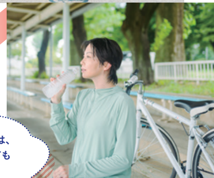
彩湖・道満グリーンパーク