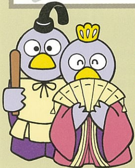
埼玉県のマスコット コバトン Prefectural Mascot "KOBATON"